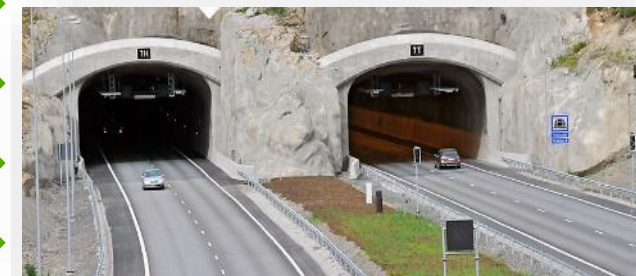
Tunnelin kalliotekninen turvallisuus käyttövaiheessa: